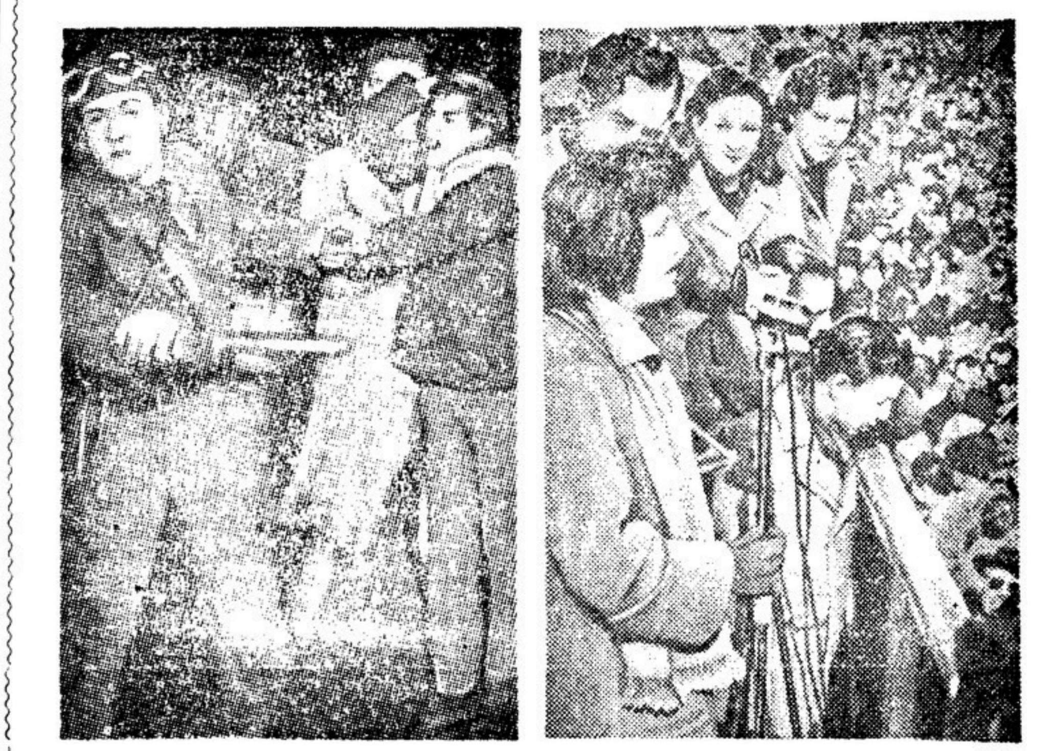
Итальянские трудящиеся гневно протестуют против присоединения Италии к Атлантическому блоку...